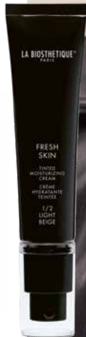
FRESH SKIN 1 / 2 LIGHT BEIGE