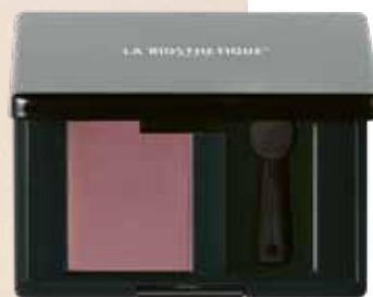
MAGIC SHADOW 50 SMOOTH PINK

Für glänzend glatte Looks: Heat Protector für Hitzeschutz beim Thermostyling.