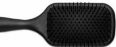
Bürste Denman D83 Large

Für Traumlängen gilt es, das Haar möglichst lange in der Wachstumsphase zu halten. Die Kopfhautpflege mit dem Growth Booster stimuliert die Zellaktivität an der Haarwurzel, während das Hair & Nail Strengthening Food Supplement gesundes, kräftiges Haarwachstum von innen unterstützt.